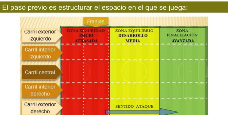
Ilustración 2. El paso previo es estructurar el espacio en el que juega:

Por su comprensión global y entrenamiento vamos a considerar la transición como una fase del juego mucho más amplia (fase de transición), que se inserta indispensablemente en la fase anterior (con una serie de movimientos preparatorios) y en la fase posterior (con el despliegue, caso de pasar al ataque o con el balance defensivo, caso de pasar a la defensa).