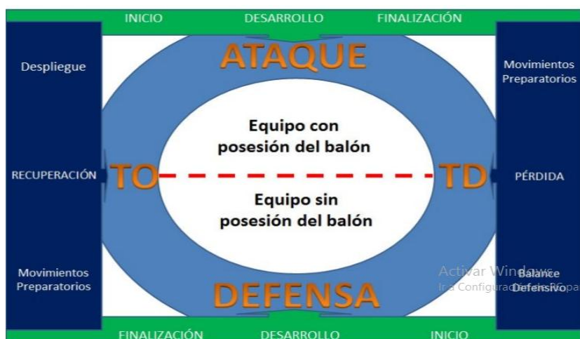
Ilustración 3. Fases de transición.

En función del cambio en la posesión del balón: transición ataque-defensa / transición defensa ataque.