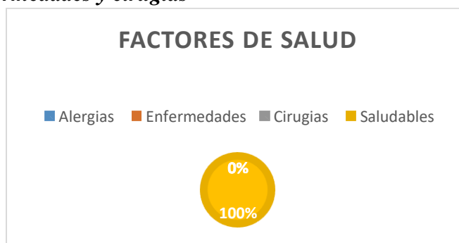
Gráfica # 2 Factores de salud del grupo tenis de campo del programa CARD 2017 – II.

En la siguiente grafica se puede observar que el 100% de los niños del grupo de la disciplina deportiva tenis de campo esta saludable, y que no posee algunas alteraciones en su cuerpo, tampoco algún tipo de anormalidad en su salud.