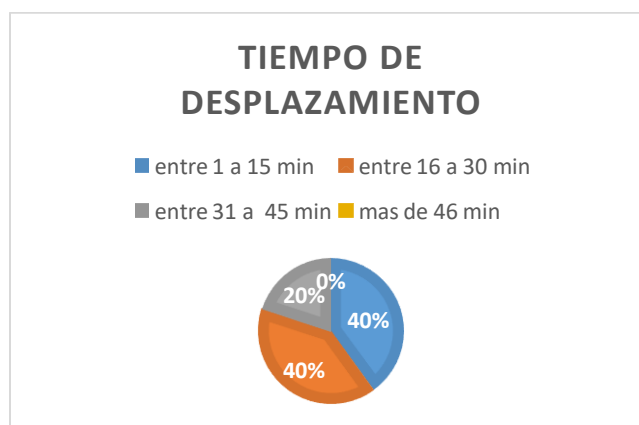
Gráfica # 3 Tiempo de desplazamiento del grupo tenis de campo del programa CARD 2017 – II.

La grafica numero 5 nos muestra que el 40% de los niños tarda en llegar al centro académico deportivo CAD entre 1 a 15 minutos, el otro 40% tarda entre los 16 a 30 minutos, el 20% se toma en llegar al centro deportivo entre 31 a 45 minutos.