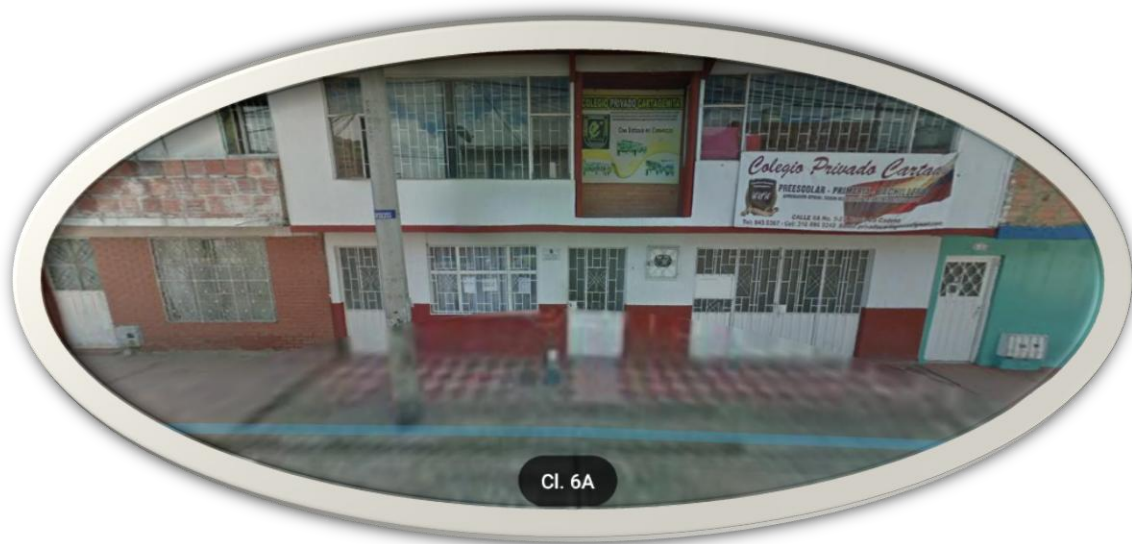
Figura 3. Fachada Liceo Tecno-Cultural Atenea del barrio Cartagena Facatativá (Cundinamarca)