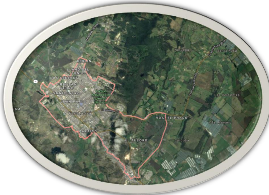
Figura 1. Ubicación Facatativá, Cundinamarca.