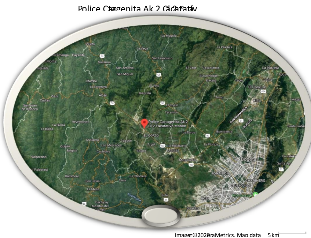
Figura 2. Ubicación Barrio Cartagenita (Facatativá, Cundinamarca)