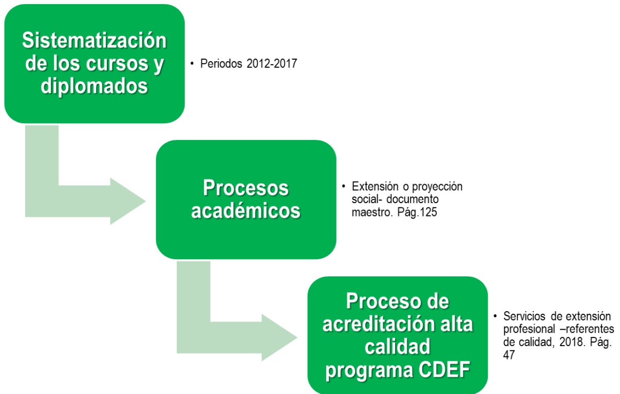
Tabla 3. Proceso de Acreditación.