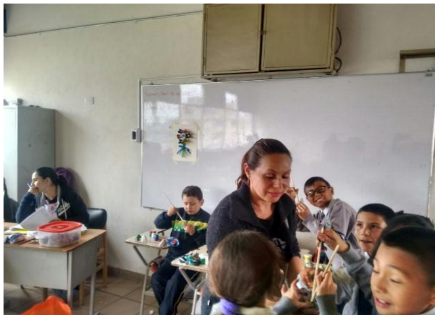
Ilustración 5. Elaboración cuadro decorativo

Con la elaboración de este cuadro decorativo, los niños tuvieron bastante participación activa, a través de esta dinámica. Esto permite evidenciar que los talleres artísticos que realizamos con material reciclable son una buena base para su desarrollo sico-motriz. (Ilustración 5)