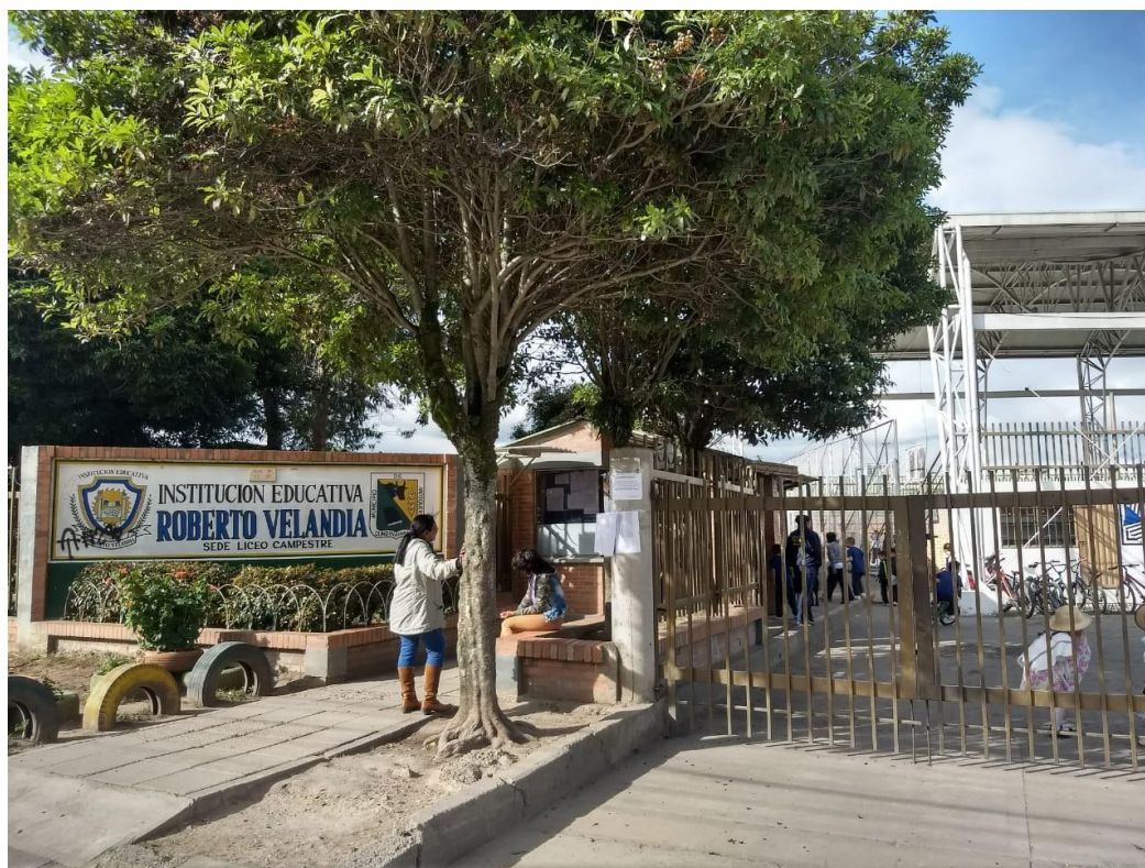
Ilustración 3. Institución Educativa Roberto Velandia (propia)