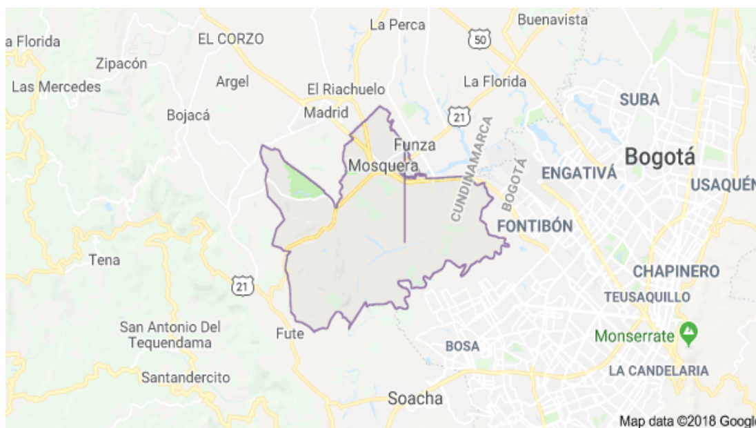
Ilustración 2. Mapa Municipio Mosquera (Secretaria de planeación Mosquera)

La ciudad de Mosquera está situada en la Provincia de la Sabana Occidente, en el Departamento de Cundinamarca, sobre la cordillera Oriental, con más de 89.108 habitantes, su extensión total es de 107 kilómetros cuadrados y con un clima entre 12 y 14°C. Mosquera limita con los municipios de Madrid, Funza, Bojacá y Soacha, Su cabecera municipal está a 2516 metros sobre el nivel del mar.