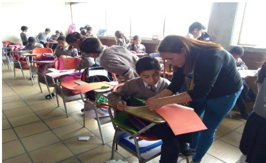
Ilustración 4. Elaboración alcancías con botellas de plástico

Con esta actividad se pudo evidenciar que los niños realizaron actividades lúdicas y creativas que les ayudan a desarrollar su imaginación de manera ingeniosa y productiva. (Ilustración 4)