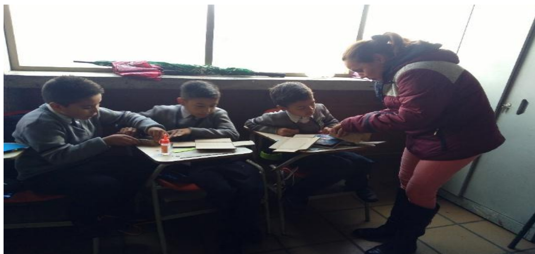
Ilustración 7. Elaboración cofre