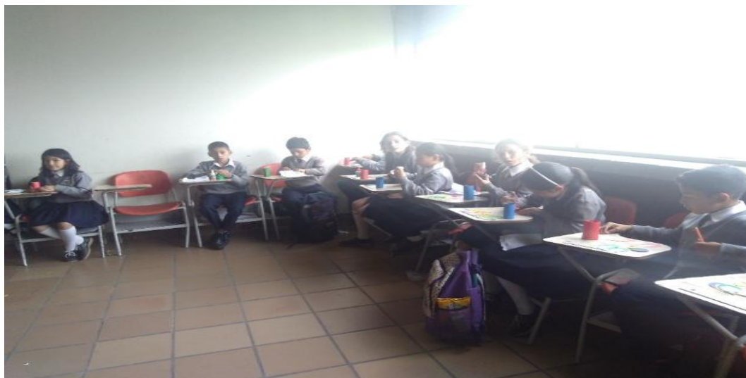
Ilustración 6. Elaboración portalápices