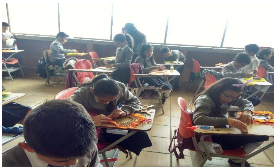
Ilustración 8. Elaboración portarretrato

En la elaboración del portarretrato se utilizaron algunas cajas de cartón que habían sido desechadas por la institución, y sirvieron de materia prima para realizar esta actividad. Finalmente se puede analizar el proceso que han tenido los niños desde el primer taller y los avances individuales como lo son: la asistencia, el interés, la participación y el compromiso hacia estas actividades. (Ilustración 8)